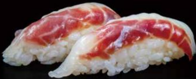
92 | BRANZINO /3€ branzino sea bass allergei | 4 °