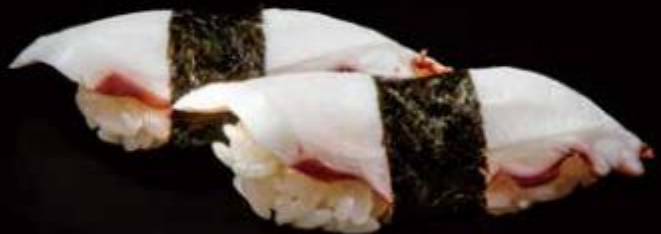
95 | TAKO /4€ polpo octopus allergeni 1,4