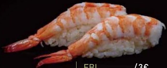
93 | EBI /3€ gamberi cotti cooked shrimp allergeni | 4