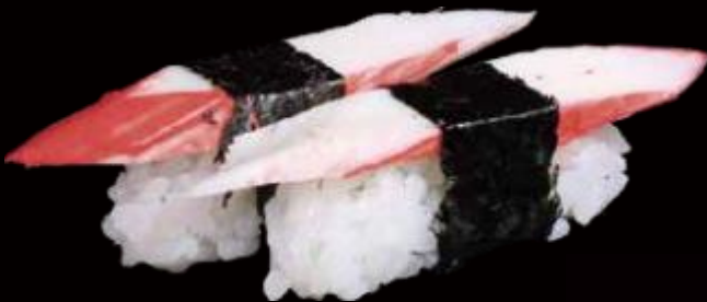
94 | KANI /3€ surimi surimi allergeni | 4