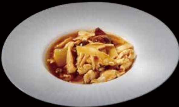
52 | POLLO FUNGHI E BAMBÙ pollo saltato con funghi e bambù sautéed chicken with bamboo and mushroom allergeni |3.6