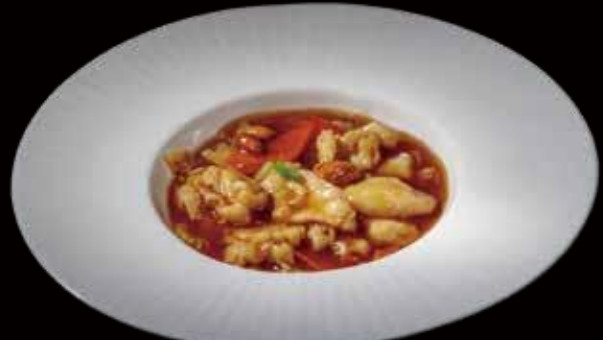
51 | POLLO ALLE MANDORLE pollo saltato con verdure e mandoreù sautéed chicken with vegetables and almonds allergeni |3.6.