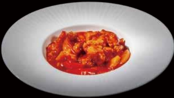
50 | MAIALE IN AGRODOLCE maiale fritto in salsa agrodolce fried pork in sweet and sour sauce allergeni |1