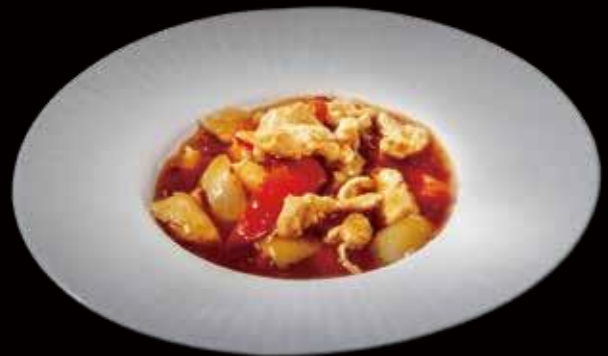
53 | POLLO PICCANTE pollo saltato con peperoni cipolla e salsa chili sautéed chicken with carrots onion pepper and spicy sauce allergeni |3.6.15