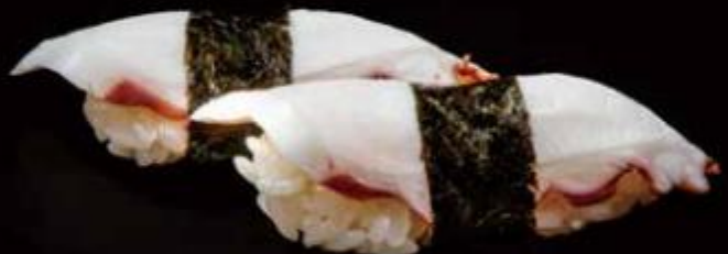
95 | TAKO /4€ polpo octopus allergeni 1,4